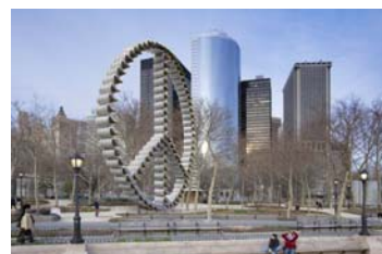
SPS proposal for Battery Park in NY

Das Projekt Solar Peace Sculpture besteht aus 85 Ölfässern, versehen mit Solarzellen und zusammengeschweisst zu einem 15 Meter hohen Friedenszeichen, und ist ein Manifest gegen die Abhängigkeit vom Öl, und für alternative Energien, Nachhaltigkeit, Klima und Frieden. Es wurde auf der Klima-Konferenz 2009 in Kopenhagen vorgestellt und wird zum Earth Day 2011 in Washington DC aufgebaut.